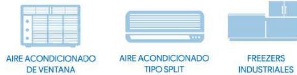
AIRE ACONDICIONADO DE VENTANA